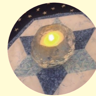
キャンドル (なくてもできるが、ある方が楽しい)