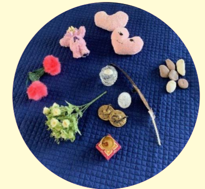
センターマット (中心を明確にする)