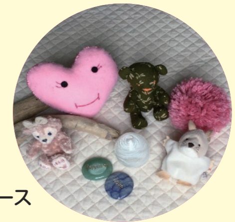
トーキングピース