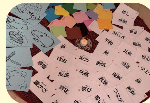
カード (言葉カード、色カード、イラスト、写真カード)